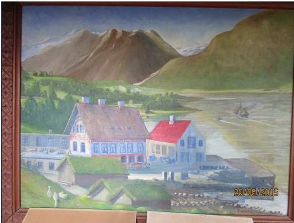
Målarstykke av F. Walter. Det syner bustadhus, fabrikk og kaia, der større skip kunne legge til.