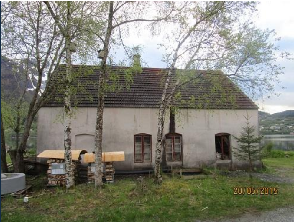
Sementsteinfabrikken i Jaktevika. Merk taksteinen, tilsynelatende like god i dag som for 80 år sidan.