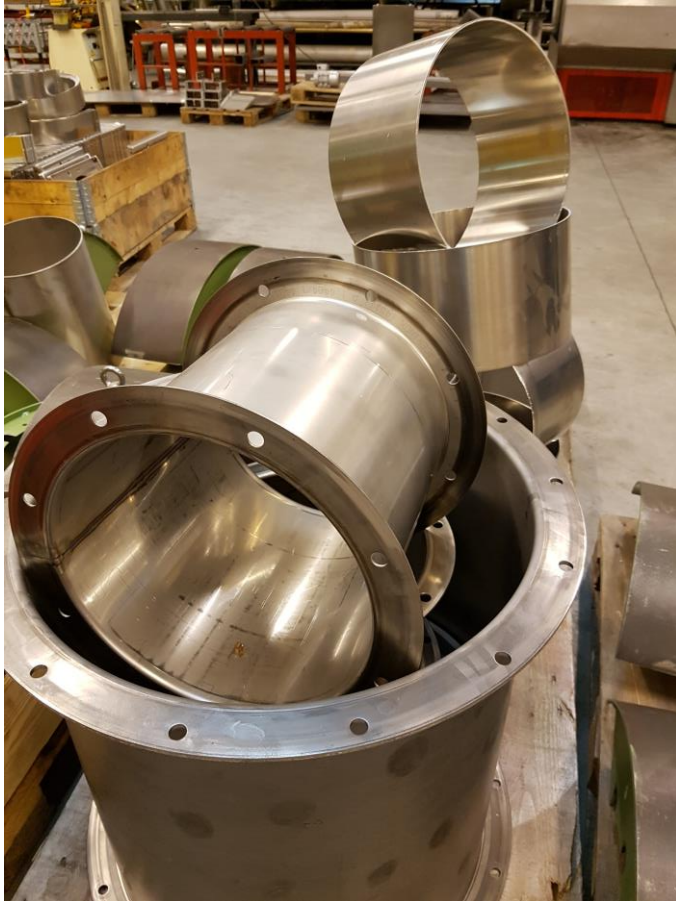
Ventilasjonsdeler i rustfritt stål, tru?