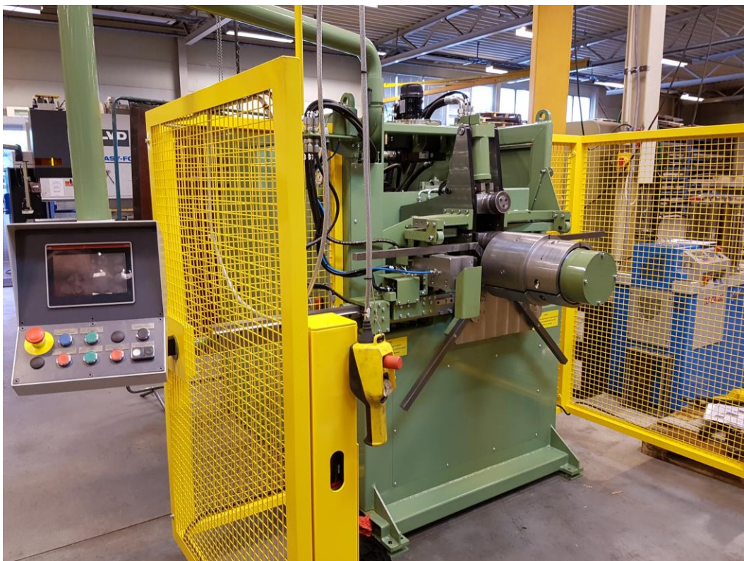
Rett maskin til rett arbeid.... Utan at referenten fekk med seg kva ho kunne gjere...